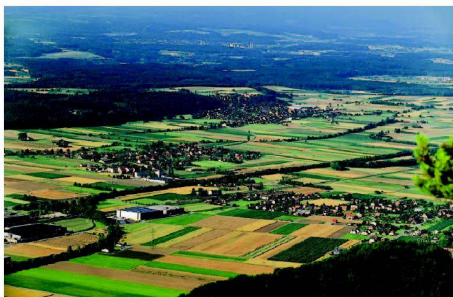
Abb. 1: Ist eine Erweiterung von Arbeitszonen sinnvoll?

Die Richtpläne stellen das wichtigste Koordinationsinstrument der Kantone für