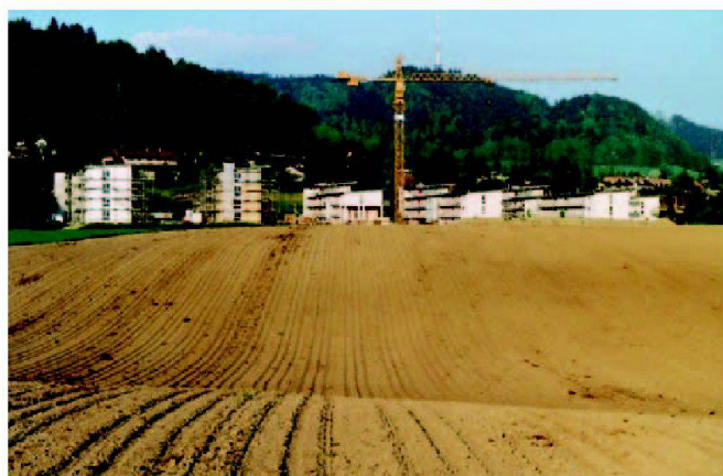
Abb. 2: Die rasante Siedlungsausdehnung bedrängt die landwirtschaftliche Nutzfläche.