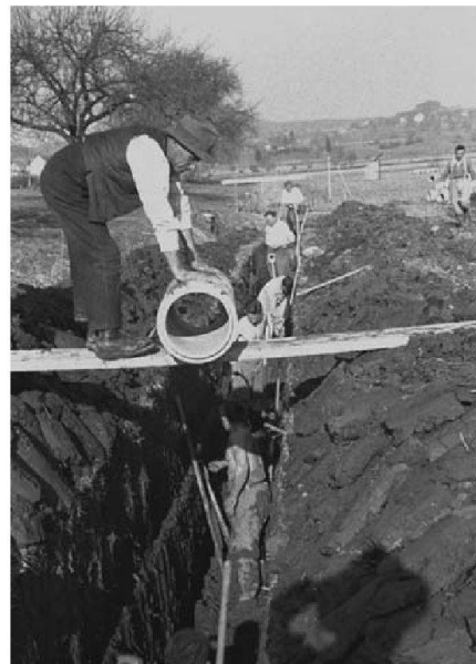
Abb. 1b: Intensive Handarbeit an einem Zürcher Drainagesystem um 1920.

Die ältesten, staatlich unterstützten Zürcher Drainagen stammen aus dem Jahre 1880, die neusten «Rekonstruktionen» wurden in den vergangenen Jahren er-