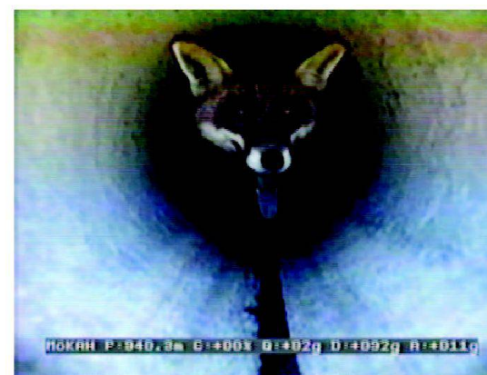
Abb. 9: Defekte «Froschklappen» ermöglichen fremden Besuchern den Zugang ins Drainagesystem: Drainageblick (in die Zukunft?) einmal anders...

Inwieweit bei überalterten Entwässerungsanlagen der Entscheid zu welchen Massnahmen wo «top down», d.h. von Kanton (und evtl. Bund), oder «bottom up», d.h. von Landwirt und Unterhaltgenossenschaft, gefällt werden soll, dürfte in fast allen Fällen bei grösseren Anlagen klar beantwortet werden können: Kaum eine Nutzwert-Analyse wird positiv ausfallen für die Rekonstruktion einer sys-