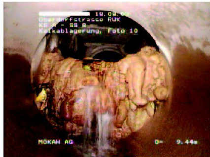
Abb. 3: Ein kräftig verockertes Sammlerrohr.