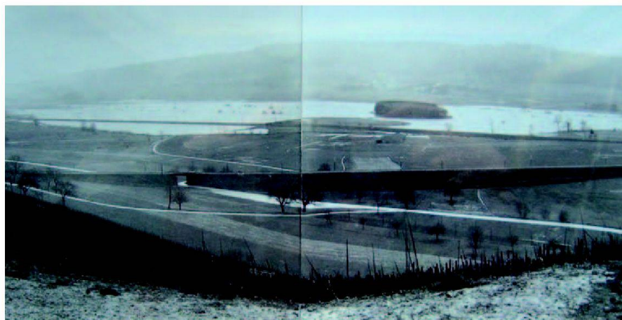
Abb. 7: Das Furttal war früher eine Sumpflandschaft. Die Aufnahme stammt von einer Überschwemmung am 31. Dezember 1918.