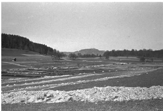
Abb. 1a: Die meisten Flächendrainagen im Kanton Zürich wurden vor 50 bis 120 Jahren angelegt.