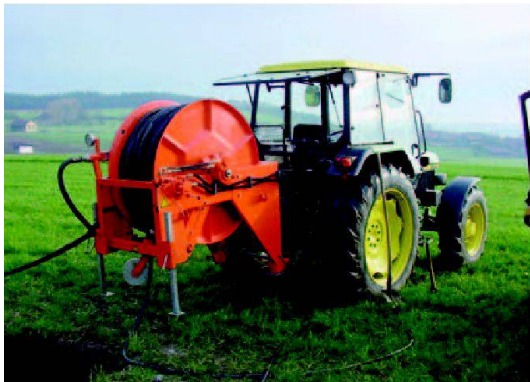
Abb. 5: Modernes Spülgerät für die Hochdruckreinigung von Rohren mit kleinen Kalibern.

Ablagerungen und schwemmt sie nach hinten aus. Der hohe Druck der nach rückwärts gerichteten Wasserstrahlen kann allerdings beschädigte Rohre noch weiter zerstören. Zudem kann sich die Düse bei Rohrknicken und -brüchen ins Erdreich hineinfressen, was zu extrem unschönen, aufwändigen Aufgrabungen und Ersatz von Rohrteilen führen kann. Tatsächlich kann man mit unsachgemäss ausgeführten Hochdruckspülungen mehr Schaden als Nutzen anrichten.