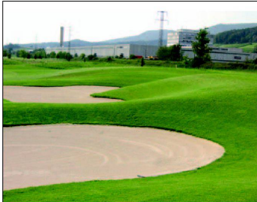
Abb. 8: Das gleiche Tal heute: Die künstlich angelegten Hügel liegen auf den alten, z.T. noch funktionstüchtigen Drainagen und sollen den neuen Golfplatz (Rietholz, Otelfingen) landschaftlich attraktiv machen...

Bund erhältliche Gelder und Unterstützung