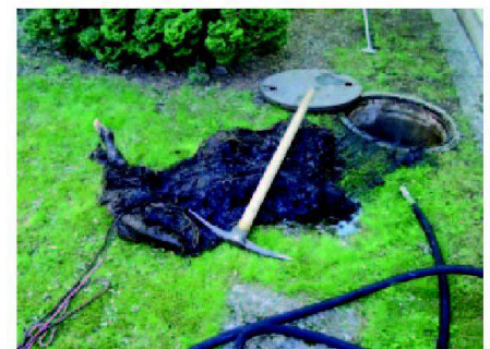
Abb. 4: Jeder Unterhalt beginnt mit dem Reinigen der Schächte.

Die Niederdruckspülung hat den Vorteil, dass sie Rohrschonend ist und mit in der Landwirtschaft vorhandenen Geräten (Druckfässern u.a.) gearbeitet werden kann. Auf der anderen Seite ist sie nicht so wirkungsvoll und man muss die Sauger (auch die Sammler, falls keine oberliegenden Schächte vorhanden sind) oben aufgraben. Bei der Hochdruckspülung braucht man ein entsprechendes Spülgerät und ausgebildetes Personal: Eine Düse am vorderen Ende des Spülschlau- ches arbeitet sich im «Rückstoss-Prinzip» von unten nach oben ins Rohr, löst die