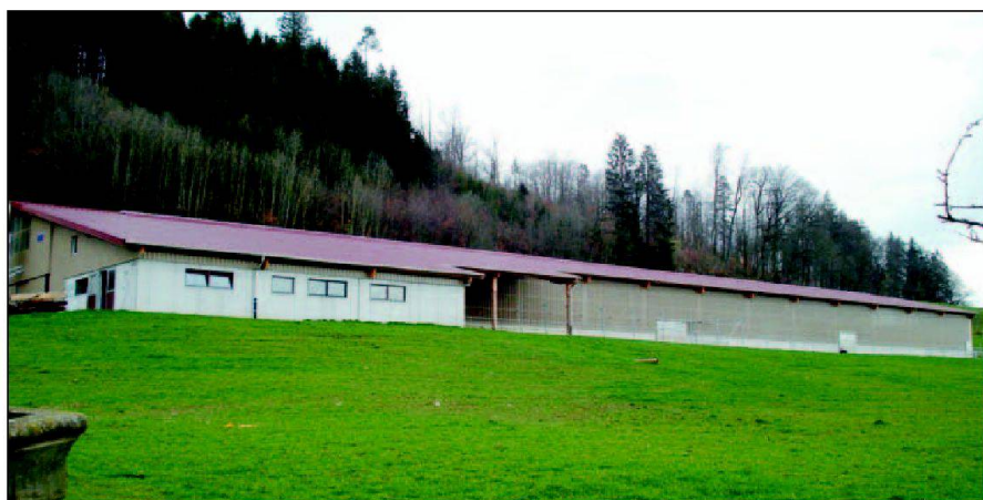
Abb. 1: Gesamtansicht des neuen Milchvieh-Boxenlaufstalles der Gemeinschaft. Im Vordergrund der Raum für das Milchzimmer und das Melk-Karussell. Anschliessend der Warteraum der Kühe vor dem Melken (überdacht) und der Laufhof entlang der Südseite des Gebäudes.

Die Abteilung Strukturverbesserungen des Bundesamtes für Landwirtschaft fördert verschiedene Zusammenarbeitsformen von Landwirtschaftsbetrieben. Zum Beispiel können für den Neubau eines Milchvieh-Laufstalles im Berggebiet Beitragspauschalen für max. 80 GVE und IK-Pauschalen (IK = Investitionskredite, zinsfrei, rückzahlungspflichtig) für max. 120 GVE gewährt werden. Dem gegenüber können bei einzelbetrieblichen Bauvorhaben Beitragspauschalen für max. 40 GVE und IK-Pauschalen für max. 60 GVE ausgerichtet werden. Zudem ist es bei gemeinschaftlichen Ökonomiegebäuden mit mindestens drei Partnerbetrieben möglich, über die 120 GVE-Limite hinaus die halbe IK-Pauschale zu gewähren. Voraussetzung zur Ermittlung des anrechenbaren Raumprogramms für eine Unterstützung sind die langfristig gesicherte landwirtschaftliche Nutzfläche sowie die Produktionsrechte wie Milchlieferrechte.