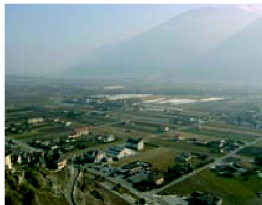
Fig. 6: Utilisation du sol à Saillon.

A la rédaction de cet article (août 2007), le projet AFI de Brigerbad-Raron a été mis en œuvre par décret par le Conseil d'état valaisan suite au plébiscite des propriétaires et exploitants du périmètre pour ac-