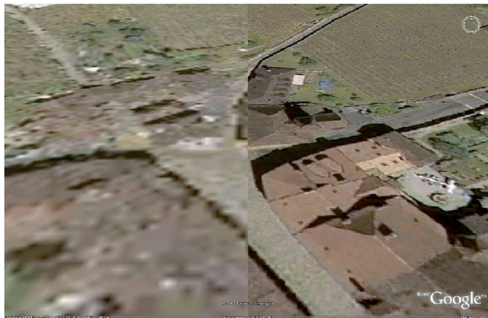
Fig. 1: Comparaison de l'image WMS et Tiles2kml lors de l'inclinaison du globe.

nologie permet l'affichage d'image raster par le simple envoi d'une requête standardisée à un serveur WMS. GE intègre ce standard depuis sa version 4.