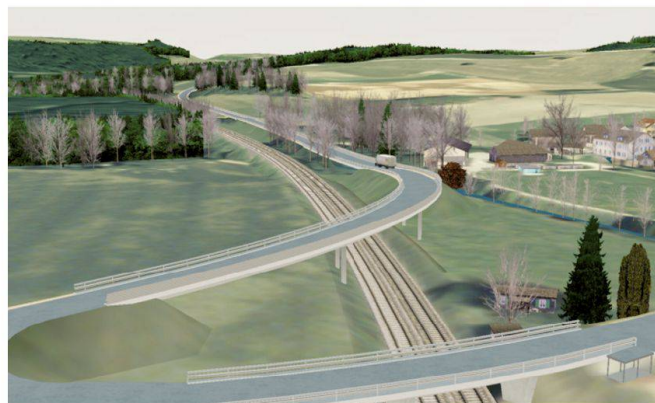
Fig. 4b: Passage des voies CFF (variante 2).