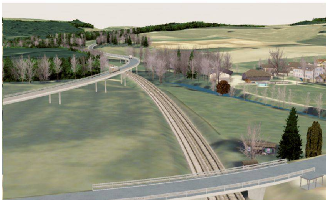
Fig. 4a: Passage des voies CFF (variante 1).

deux variantes à l'ouest du village de Vufflens-la-Ville. Grâce à la visualisation en temps réel, les variantes d'exécution sont librement commutables et on peut les comparer de tous les angles de vue.