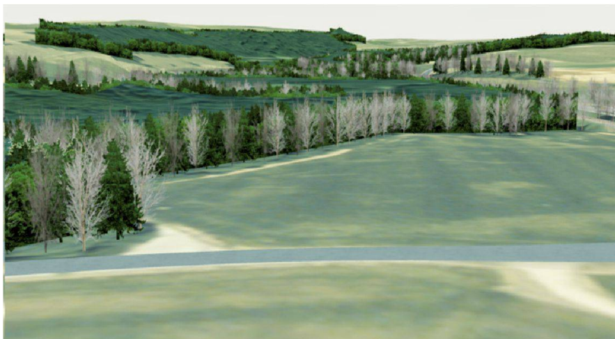
Fig. 3: Détail des lisières de forêts de synthèse.

MNT25 (modèle numérique du terrain à 25 m) de Swisstopo «habillée» avec la prise de vue aérienne correspondante orthonormée. Une vue de vol d'oiseau de la maquette est représentée dans la figure 2 et on voit sur la partie gauche de l'image la structure de la maquette composée de triangles. Dans cette vue, il y a environ 45 000 triangles texturés qui doivent être calculés 20 fois par seconde ou plus. Un PC portable avec un processeur graphique de la dernière génération y arrive sans problèmes.