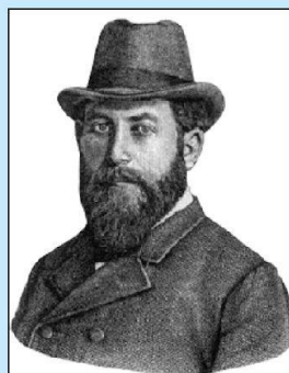
Xaver Imfeld (1853–1909)

Panoramen- und Reliefkünstler Xaver Imfeld: