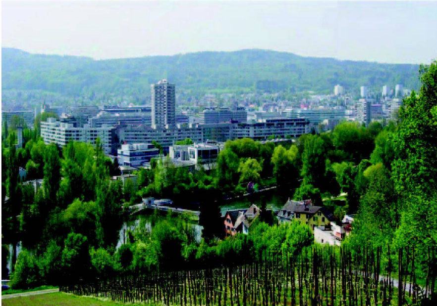
Abb. 1: Der Limmatraum im Bereich der Zürcher Stadtquartiere Höngg und Grünau.

wicklungskonzept (LEK) Limmatraum erarbeitet. Ein LEK ist ein informelles Planungsinstrument, dessen generelles Ziel es ist, die Landschaft als Lebensgrundlage für Menschen, Tiere und Pflanzen zu erhalten und aufzuwerten. Ein LEK behandelt dabei die gesamte Landschaft mit allen landschaftsrelevanten Nutzungen. Im Ergebnis stellt das LEK ein Bild des wünschbaren, zukünftigen Landschaftszustandes dar und benennt konkrete, zur Realisierung dieses Zielzustandes notwendige Massnahmen. In die Erarbeitung des LEK werden die betroffenen Nutzer- und Interessengruppen, wie z.B. Grundeigentümer, Bewirtschafter, Erholungssuchende und Anwohner mit einbezogen. Mit dem LEK Limmatraum Stadt Zürich werden folgende Ziele angestrebt: