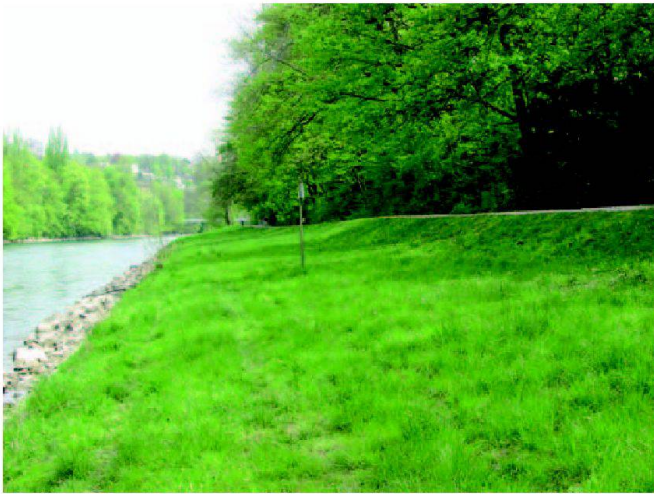
Abb. 3: Die Ufer der Limmat wurden über weite Strecken begradigt.