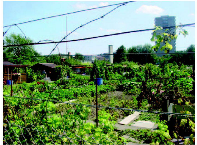
Abb. 4: Die Familiengartenareale im Limmatraum sind eingezäunt und für Fussgänger und Velofahrer nicht passierbar.

Limmatraumes kennen zu lernen und als wichtige Grundlage in die Erarbeitung des Konzeptes einfließen zu lassen. Konkret waren an den Veranstaltungen folgende Gruppierungen vertreten: organisierte Nutzer (z.B. Vereine, Interessengemeinschaften), nicht organisierte Nutzer (z.B. Jogger, Pächter), Anwohner, Betriebe und Gewerbe sowie kantonale und städtische Ämter.