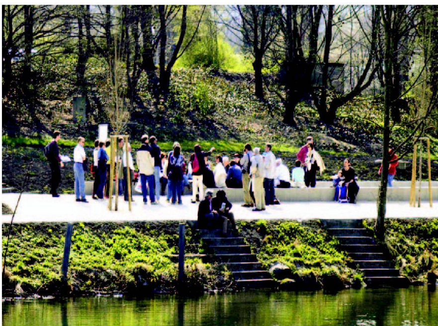
Abb. 8: Neu geschaffener öffentlicher Aufenthaltsbereich an der Limmat.

Indem die Nutzer und die Bevölkerung eng in die Erarbeitung des LEK miteinbezogen wurden, konnte die Planung besser an deren Ansprüche und Bedürfnisse angepasst werden. Ein wichtiger Aspekt war dabei die Erschliessung von lokalem, in der Verwaltung fehlendem Wissen. Unter den Teilnehmenden an den Mitwirkungsveranstaltungen liessen sich zudem gegenseitige Lerneffekte und teilweise der Abbau von traditionellen Vorurteilen feststellen. Natürlich konnten im Rahmen des LEK nicht alle Ansprüche der verschiedenen Nutzergruppen berücksichtigt werden; oftmals mussten Kompromisse geschlossen oder übergeordnete öffentliche Interessen vorangestellt werden. Es ist wichtig, diese Abläufe im Rahmen der Mitwirkungsveranstaltungen transparent zu machen und die vorhandenen Rahmenbedingungen und Spielräume klar zu deklarieren. Ansonsten werden bei den Teilnehmenden falsche Erwartungen geweckt.