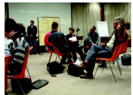
Abb. 5: Im Rahmen des LEK Limmatraum wurden Workshops mit Nutzern und Bevölkerung durchgeführt.

gelistet, die realisiert werden müssen, um den angestrebten Zielzustand zu erreichen. Für die Massnahmen werden Prioritäten und Zuständigkeiten angegeben. Die Umsetzung der zahlreichen, sehr unterschiedlichen Massnahmen wird etappenweise und entsprechend ihrer Priorität angegangen. So kann überprüft werden, ob die realisierten Massnahmen die gewünschten Verbesserungen bringen und die Planung kann an veränderte Bedingungen angepasst werden. Erste Massnahmen, wie die Gestaltung von öffentlichen Aufenthaltsbereichen am Fluss (Abb. 8), konnten bereits umgesetzt werden. Weitere Massnahmen, wie die Verbreiterung eines Uferwegabschnitts, die Öffnung eines eingedolten Bachlaufs und die Renaturierung eines Limmatabschnitts mit einem Auenwaldrelikt, befinden sich in der Planungsphase.