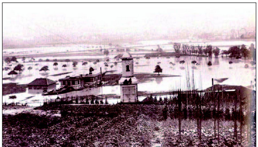
Abb. 2: Überschwemmung im Limmattal bei Höngg um 1880 (aus: Geologie von Zürich, H. Jäcklin, 1989).

Ziel war es, das lokale Wissen sowie die Anliegen und Bedürfnisse der Teilnehmer bezüglich der künftigen Entwicklung des