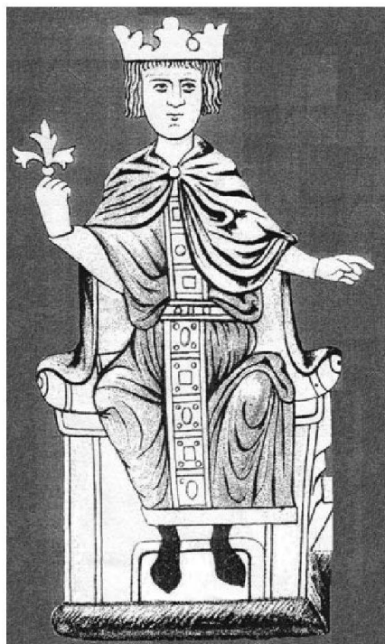
Abb. 1: Kaiser Friedrich II., Widmungsbild um 1230.

Friedrich II. von Hohenstaufen (1194–1250) war eine ausserordentliche Persönlichkeit (Abb. 1). Vater und Mutter verlor er früh. Unter abenteuerlichen Umständen wuchs er in Sizilien auf, meist in Palermo. Im Alter von 17 Jahren erreichte ihn der Ruf der deutschen Fürsten, ihr König und Kaiser zu sein; die Kaiserkrönung fand 1212 statt. Friedrich betrachtete sich als Sizilianer und war zeitlebens mit seinem Königreich Sizilien (Insel und süditalienisches Festland) verbunden (Abb. 2). Er sorgte dort für eine rege Bautätigkeit; Friedrichs Interesse für Architektur und architektonische Planung ist vielfach belegt. Auf der Insel und dem Festland wurden mehrere Kastelle, Paläste und Jagdschlösser errichtet. Besonders bemerkenswert ist das um 1240 errichtete Castel del Monte in Apulien (Abb. 3). Das oktagonale Bauwerk macht heute einen