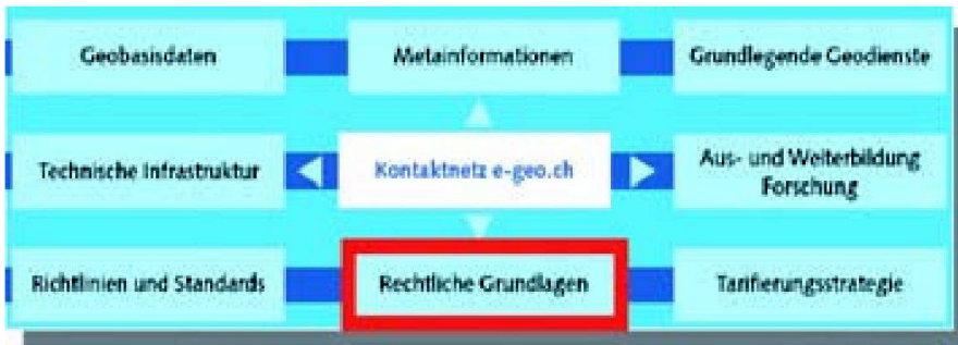
Abb. 2: Elemente der Nationalen Geodaten-Infrastruktur (NGDI).