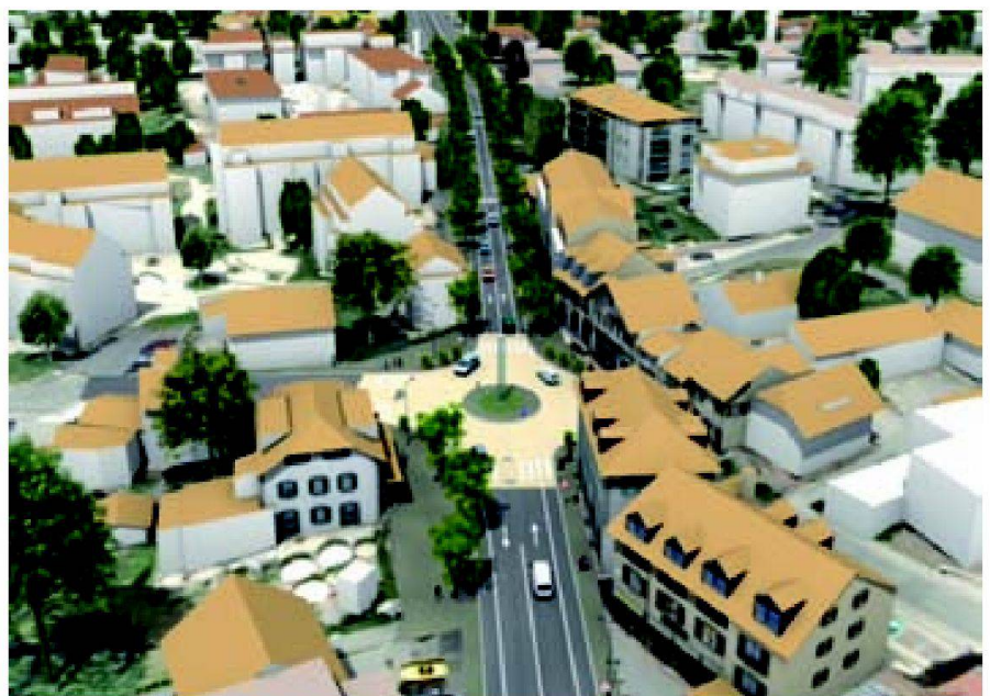
Fig. 3: Genève 3D.

En matière d'outils de politiques publiques, les apports de la troisième dimension constituent sans conteste une percée prépondérante. Tant pour ce qui concerne la gestion du territoire au quotidien, que pour la compréhension des projets, la concertation entre les collectivités, les élus et la population, mais aussi et surtout pour son aide à la prise de décision. La base de données 2D dont dispose Genève est déjà très complète (Système d'information du territoire genevois www.sitg.ch ). En intégrant des informations concernant les volumes réels, les hauteurs et les surfaces des objets, les autorités genevoises sont en passe de franchir un nouveau seuil. En effet, l'enrichissement des méthodes de représentation du territoire est un atout pour la mise en œuvre coordonnée des politiques publiques relevant notamment de l'aménagement du territoire, de la mobilité, de l'environnement, de la nature et du paysage, de l'agriculture et de l'eau.