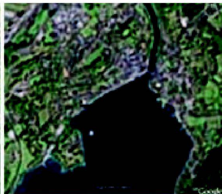
Luftbilder in Google (links neu; rechts bisher).