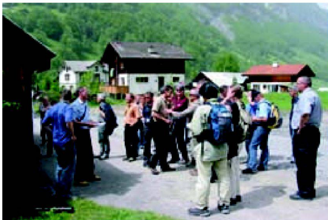
Abb. 3: Intensive Diskussionen unter den Fachleuten.