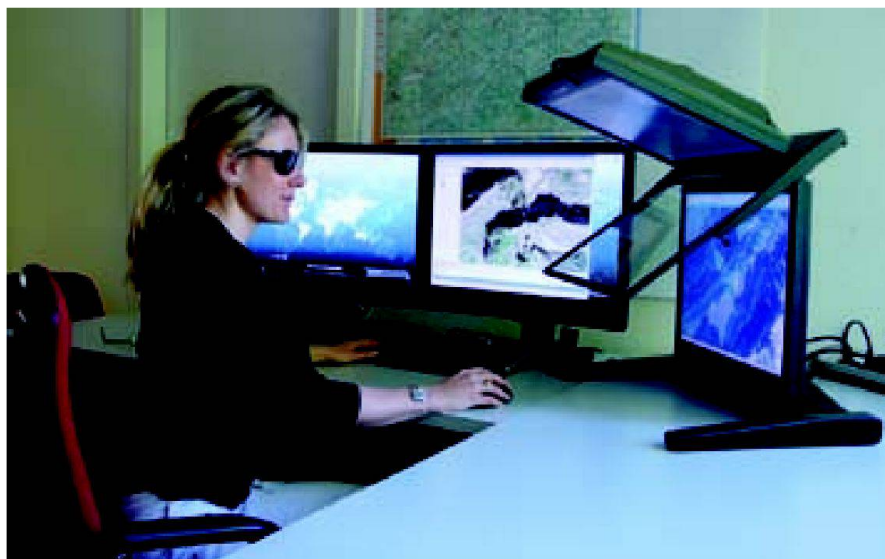
Abb. 4: TOPGIS 2.5D- und 3D-Benutzerin am Stereobildschirm.

bute. Das DTM-TLM wird parallel zu TLM aktualisiert und ist im Geodatabase Terrain-Format gespeichert. TLM und DTM-TLM decken die ganze Fläche der Schweiz ab. Die Daten im Ausland werden nicht durch swisstopo erfasst, sondern von den entsprechenden nationalen Geodatenproduzenten erworben und in das TLM integriert. Ausserhalb der Schweizer Grenze sind Lagegenauigkeit und Inhalt des TLM und DTM-TLM auf die Ansprüche der Kartenproduktion reduziert. TLM und DTM-TLM Daten basieren auf dem Bezugsrahmen LV95 und dem Landeshöhennetz LHN95 (Bezugssystem CH1903+).