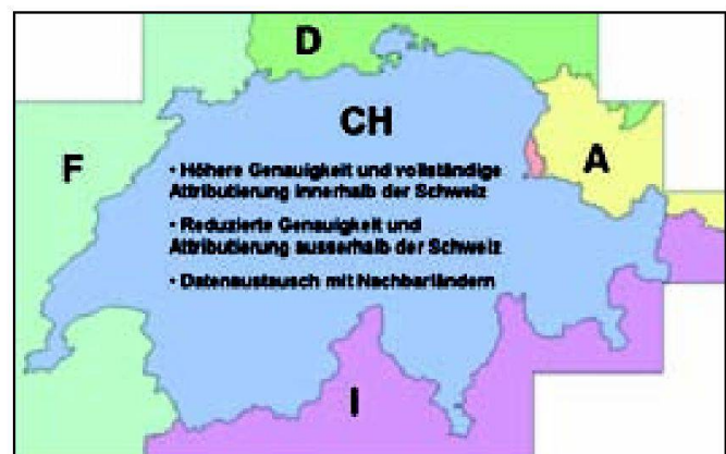
Abb. 3: TLM-Perimeter im Bereich der Landeskarte 1:100 000.