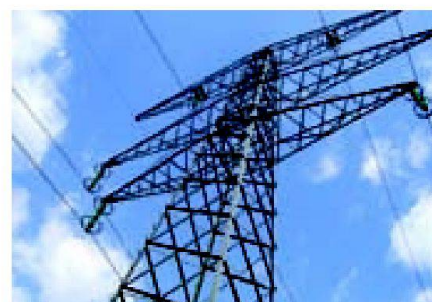
Fig. 2: Les lignes électriques peuvent parfois être une source de courants vagabonds.

Des sources de courants vagabonds en dehors de l'exploitation agricole sont possibles, et peuvent avoir une importance souvent insoupçonnée. Il a déjà été constaté sur des structures d'installations de traite proche de lignes de chemin de