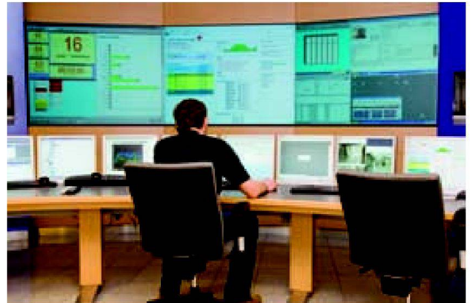
Schnelle Auskunft: Mit einem Klick erkennen Mitarbeiter bei LIWEST, ob ein Hausanschluss von einer Störung betroffen ist.