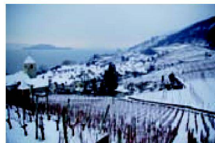
Abb. 10: 5. Januar 2009, die Reben ob Twann in der Winterruhe, wartend auf die neuen Eigentümer.

Die öffentliche Auflage der Mehr- und Minderwerte und die jährliche Konferenz mit den Schutzorganisationen und den kantonalen Amtstellen haben bereits