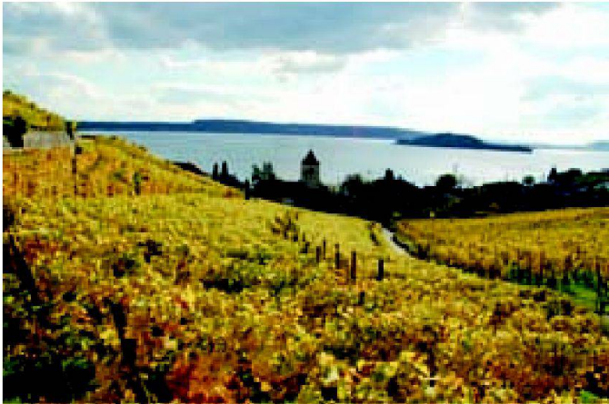
Abb. 2: Ausblick über Twann in Richtung Petersinsel.