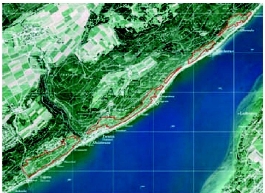
Abb. 1: Rebgüterzusammenlegung Twann-Ligerz-Tüscherz-Alfermée (TLTA).

Die Rebgüterzusammenlegung umfasst die zusammenlegungsbedürftigen, mit Reben bestockten Grundstücke (105.5 ha) des linken Bielerseeufers in den Gemeinden Ligerz, Twann und Tüscherz-Alfermée. 34 Haupterwerbs- und zehn Nebenerwerbsbetriebe bewirtschaften den Rebberg und produzieren den Wein zum grössten Teil als Selbstkelterer. Das zwischen der Nationalstrasse A5 und dem Waldrand liegende, schmale, rund 7 km lange Rebgebiet ist geprägt durch zahlreiche Terrassen mit rund 82 km Rebmauern. Die Terrassenlandschaft ist Bestandteil des Bundesinventars der Landschaften und