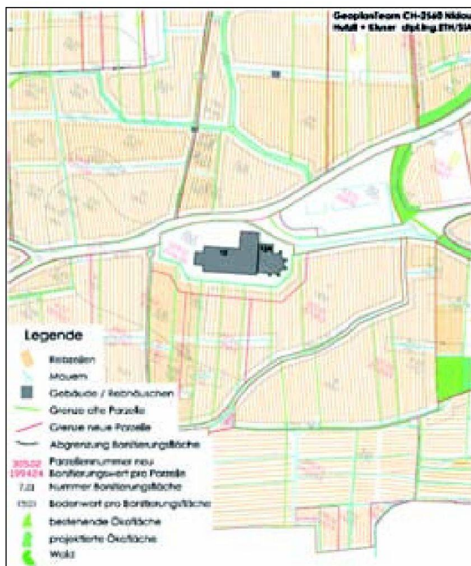
Abb. 5: Ausschnitt aus dem Arbeitsplan mit allen wichtigen Informationen zur Neuzuteilung.