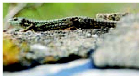
Abb. 9: Eine Mauerbewohnerin: die Mauereidechse.

Gleichzeitig mit der Neuzuteilung hat die Genossenschaft den Plan der ökologischen Massnahmen öffentlich aufgelegt; er umfasst die bestehenden naturnahen Flächen, die erhalten bleiben, und neue Ausgleichsflächen im Umfang von ca. einer Hektare, die als Vernetzungskorridore und Trittsteine zwischen den bestehenden Ökoflächen angelegt werden sollen. Die Massnahmen sind für die Genossenschaft und die Grundeigentümer verbindlich; im Grundbuch wird auf den betroffenen Parzellen die Anmerkung «Grundstück mit spezieller Bewirtschaftungspflicht» eingetragen. Als Planungsgrundlage diente das Vernetzungsprojekt vom September 2004 (gemäss Ökoqualitätsverordnung des Bundes). Die Ökoflächen wurden je nach Situation den privaten Grundeigentümerinnen und