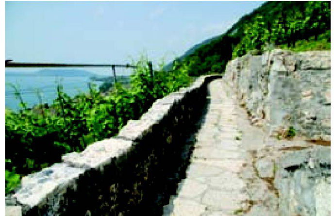
Abb. 3: ViaStoria-Objekt Pilgerweg in Ligerz.