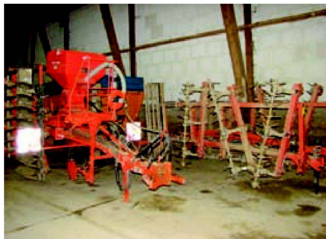
Fig. 2: Machines destinées au travail du sol de la société simple «Secossa» à Senarclens.

de montagne et la zone des collines où l'exploitation agricole du sol ou l'occupation suffisante du territoire est menacée, la charge en travail exigée par exploitation est d'au minimum 0.75 UMOS. Entre autres, les exploitations au bénéfice de la mesure collective doivent satisfaire aux conditions des prestations écologiques requises (PER).