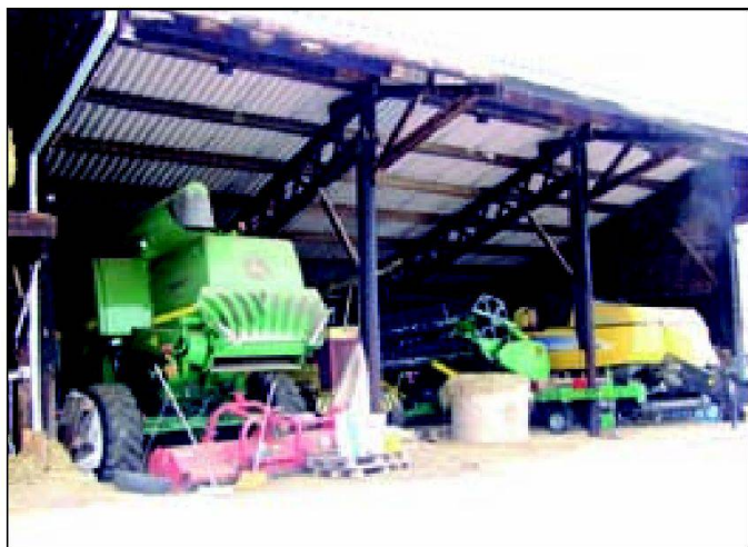
Fig. 1: Machines de la coopérative «Juragri» à Juriens et remisées dans un hangar de sa propriété.