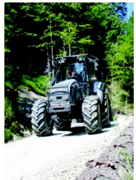
Fig. 2: Transport de bois (15 t) sur chemin gravelé en forte pente.

Sur la base d'un plan de gestion des alpages ou d'un regroupement d'alpages (voir La gestion intégrée des alpages), on