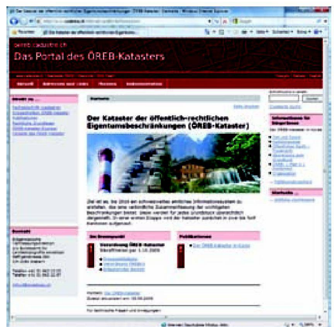
Abb. 2: Portal ÖREB-Kataster.