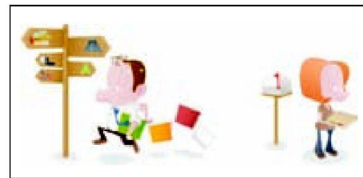
Abb. 3: Keine zeitaufwändige Suche mehr dank dem ÖREB-Kataster.

Ce ne sont pas seulement les propriétaires fonciers et les différents acteurs du marché immobilier qui pourront profiter de ce nouveau cadastre RDPPF. Les autorités et les administrations publiques pourront aussi disposer d'un excellent instrument qui leur permettra de s'acquitter efficacement de leur devoir d'information. Cela va tout à fait dans le sens de la stratégie de e-gouvernement de la Confédération qui demande d'organiser les procédures administratives de manière plus efficiente et de les rendre plus accessibles au public. Quant à l'économie, elle pourra gagner du temps et de l'argent en disposant très facilement, grâce au nouveau cadastre, d'informations adéquates sur la propriété foncière. De plus, le cadastre RDPPF permettra d'accroître la sécurité juridique. La propriété foncière en Suisse est grevée de plus de 700 milliards de francs d'hypothèques, soit plus de 100 000.– francs par habitant. Cela montre l'importance de pouvoir disposer rapidement d'informations fiables sur la propriété foncière ainsi que l'importance économique de ce nouveau cadastre.