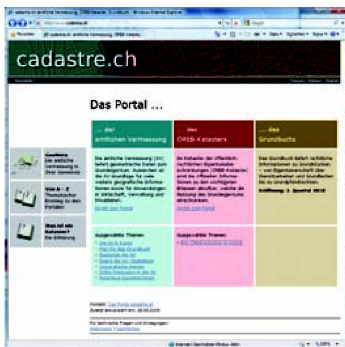
Abb. 1: www.cadastre.ch.

Der ÖREB-Kataster wird in zwei Etappen ein-