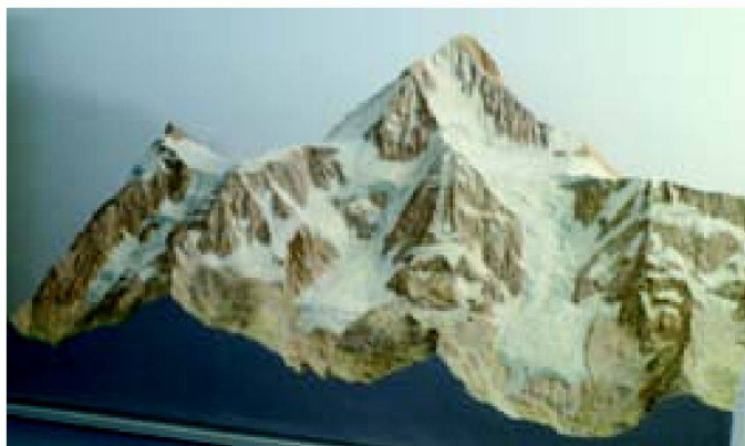
Abb. 2: Bietschhorn von Eduard Imhof.

www.fhnw.ch/habg/ivgi/institut/flyer-geomatik