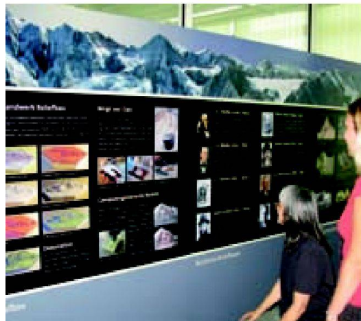
Abb. 1: Informationstafeln.