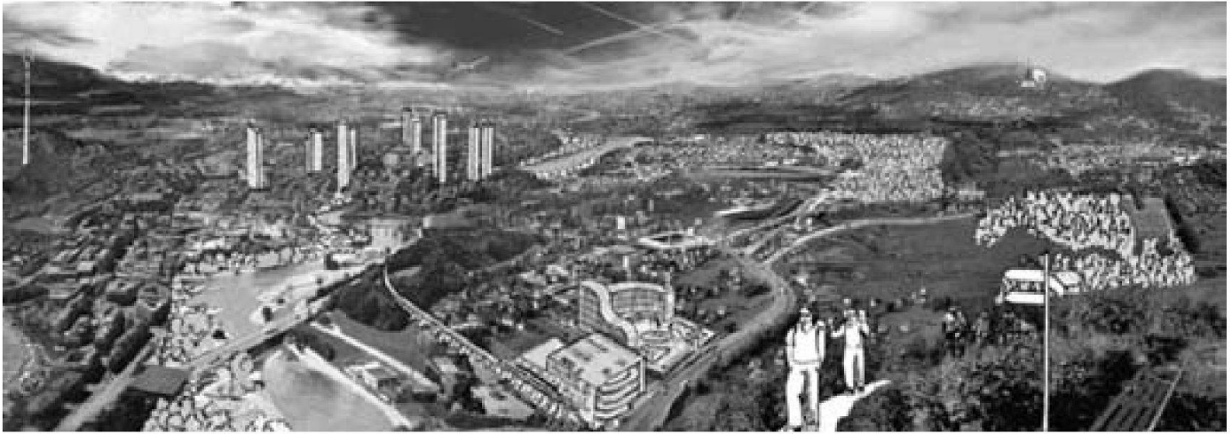
Abb. 1: Die am meisten gewünschten Entwicklungsoptionen für urbane Landschaften sind: Siedlungswachstum nach innen (dargestellt durch die Hochhäuser in der Bildmitte), effiziente ÖV-Systeme bis zum Agglomerationsrand (dargestellt durch den Park-and-Ride-Bahnhof im Vordergrund) und ökologisch aufgewertetes Siedlungsgebiet (dargestellt durch die Bäume, den Park vor dem Gewerbegebäude im Vordergrund und die Spaziergänger rechts vorne) (Bild: Zürcher Hochschule der Künste ZHdK, Scientific Visualization).

Die Befragten wollen die einzelnen Politikbereiche auch besser vernetzen. So soll beispielsweise die Agglomerationspolitik durch geschickte Gestaltung der urbanen Räume dazu beitragen, dass die Landschaft in den angrenzenden ländlichen Gebieten vermehrt freigehalten wird. Zudem sind die Befragten der Meinung, dass die Raumplanungsinstrumente noch gezielter für die Erhaltung und Aufwertung der Landschaft – insbesondere von Flusslandschaften – eingesetzt werden sollten.