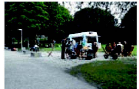
Buvetten für «kontrollierten» Konsum und gegen das Littering (Luzern).