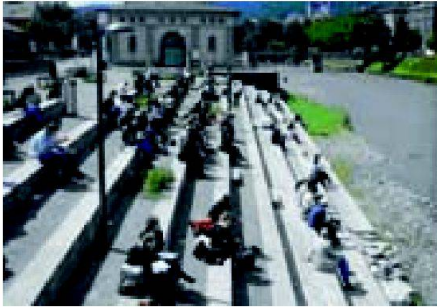
Gestaltung Gewässerraum (Zürich).

welche Funktionen ein bestimmter Raum erfüllen soll. Für bedarfsgerechte Lösungsansätze gilt es, die relevanten Akteure der öffentlichen Hand, der Wirtschaft und der Bevölkerung frühzeitig in den Planungs- und Managementprozess mit einzubeziehen. Oftmals ist dies ein lang andauernder Gestaltungs- und Aushandlungsprozess, der jedoch zu breit abgestützten und nachhaltigen Lösungen führen kann.