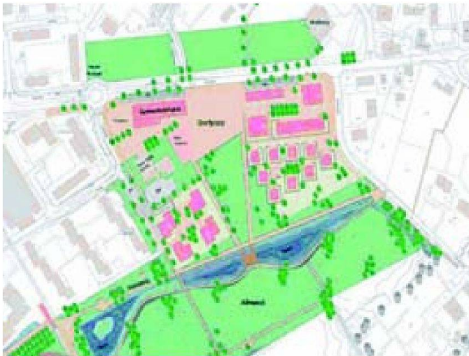
Zentrumsentwicklung Vision Gries, Volketswil.