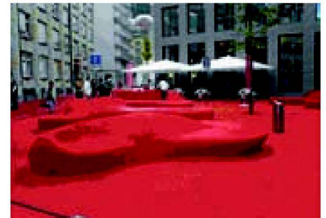
Möblierung des Stadtraums.

Till Berger Verein Future for the commons