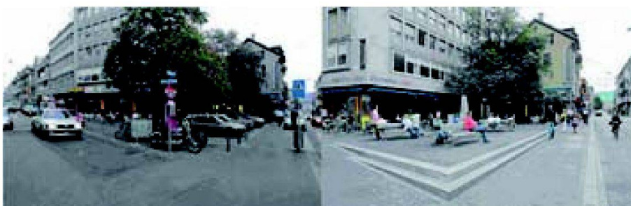
Cella Platz in Zürich (vor und nach der Realisierung 2007), «Stadträume 2010. Eine Strategie zur Gestaltung von Zürichs öffentlichem Raum».

Im Rahmen von zwölf Workshops wurden konkrete Ansätze für die Planung und das Management von öffentlichen Räumen diskutiert. Wichtige Erkenntnisse daraus sind, dass es klare Vorstellungen braucht,