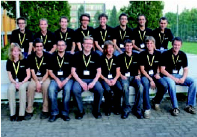
Die ersten Bachelor of Science in Geomatik FHNW.