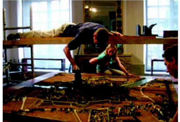
Solothurn 1830/3D: www.fhnw.ch/habg/solothurn3d .

in Geoinformationstechnologie sowie zu Anforderungen und Anmeldung auf der Studiengangsw Webseite www.fhnw.ch/habg/ivgi/master .