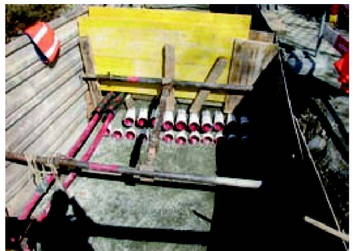
Abb. 1: ewz-Verteilnetz Rohranlage.

Graubünden stellen die Energieversorgung in diesen Gebieten mit elektrischer Energie sicher.