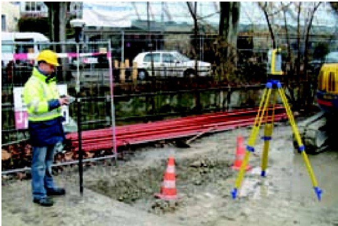
Abb. 2: Einmessung von ewz-Trasse mit Tachymeter und GNSS.

Angespiesen wird die Stadt Zürich über vier Kuppelunterwerke am Stadtrand. In den Kuppelunterwerken wird die Spannung transformiert und an die Quartierunterwerke verteilt.