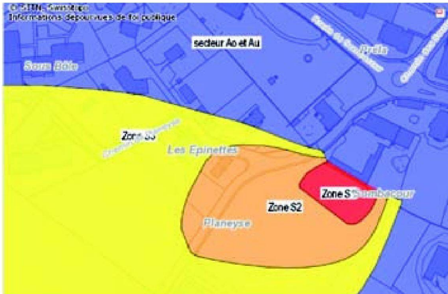
Abb. 2: Die ÖREB können vom Referenzplan unabhängig sein.

Spezialisten, der die Numerisierung des Plans vornimmt. Die Frage, «Was geschieht, wenn eine der beiden aufeinander bezogenen Informationsebenen sich ändert?» muss der Entscheidungsträger beantworten. Die Frage ist umso heikler, als der Parzellenplan privatrechtlichen Kriterien und der Nutzungsplan öffentlich-rechtlichen Kriterien unterliegt.