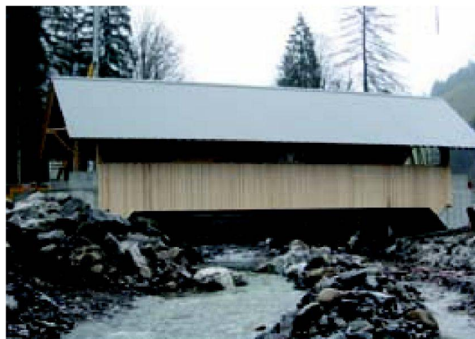
Abb. 9: Phase 4: Holzverkleidung als Wind- und Schneeschutz.