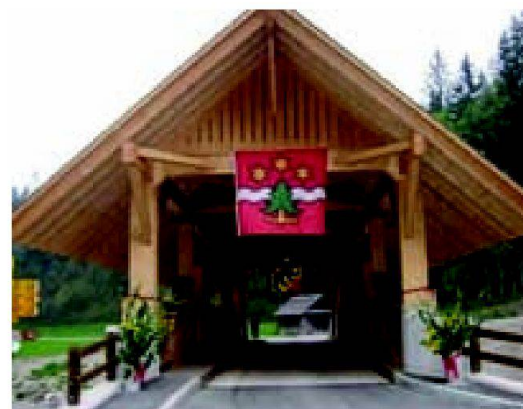
Abb. 5: Einweihung Kemmeribodenbrücke am 25. September 2009.

Ab Anfang August 2008 wurden die beiden neuen, bis 1.5 m unter die bestehende Emmesohle reichenden Betonwiderlager erstellt. Nach 2½ Monaten Bauzeit konnte ab Mitte Oktober 2008 mit