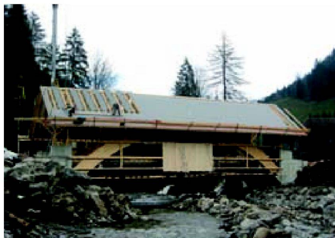
Abb. 8: Phase 3: Dachdeckerarbeiten.