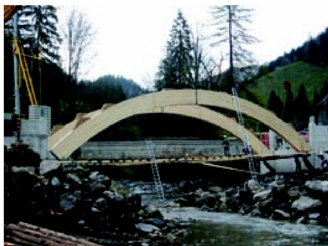
Abb. 6: Bauphase 1: Widerlager und Zweigelenkbogen.

der Montage der vorgefertigten Holzbrücke begonnen werden. Schon nach sechs Arbeitstagen war die Brücke fast fertig