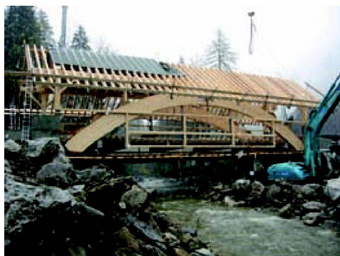
Abb. 7: Phase 2: Rohbau, Fahrbahnplatte mit Stahlhängepfosten an Gelenkbogen befestigt.