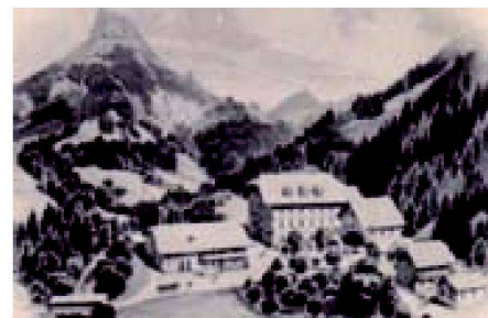
Abb. 1: Der Gebäudekomplex aus dem Jahre 1880 steht unter Denkmalschutz.