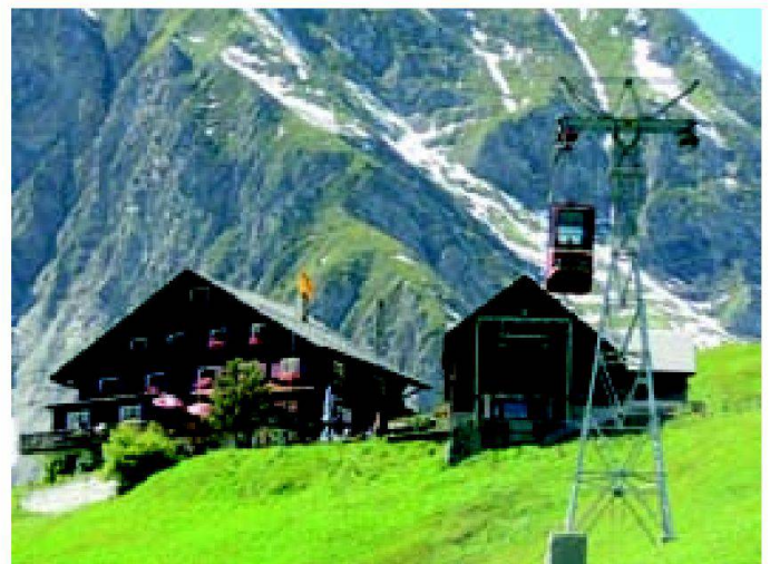
Abb. 3: Bergstation Gitschenen.