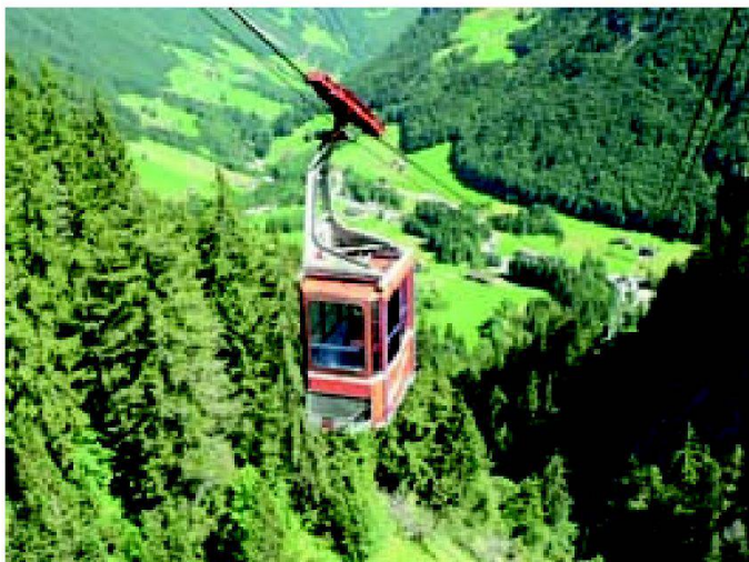
Abb. 2: Seilbahn als Lebensader.

Bei der Projektprüfung wird die Notwendigkeit und Verhältnismässigkeit einer Anlage betrachtet. Dabei werden der erforderliche Transportbedarf, die erforderliche Zeit zur Erreichung des Gebiets, das Kosten-/ Nutzenverhältnis sowie die ökonomische Gesamtsituation der Land- und Alpwirtschaftsbetriebe beurteilt. Für die technischen Belange wird das IKSS beigezogen. Die Beurteilung eines Projekts kann auch von anderen Interessen beeinflusst werden, insbesondere wenn es sich um Bundesinventare handelt. Dazu sind entsprechende Mitberichte auf Kantons- und Bundesstufe einzuholen.