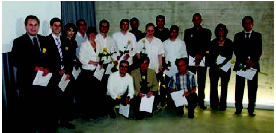
Absolventinnen und Absolventen des BSC in Geomatik FHNW 2010 mit den gerade überreichten Diplomen.

Am 24. September 2010 wurden in einer gemeinsamen Abschlussfeier aller Studiengänge der Hochschule für Architektur, Bau und Geomatik FHNW in den Räumen der Regent Beleuchtungskörper AG in Basel unter reger Beteiligung von Angehörigen der Absolventinnen