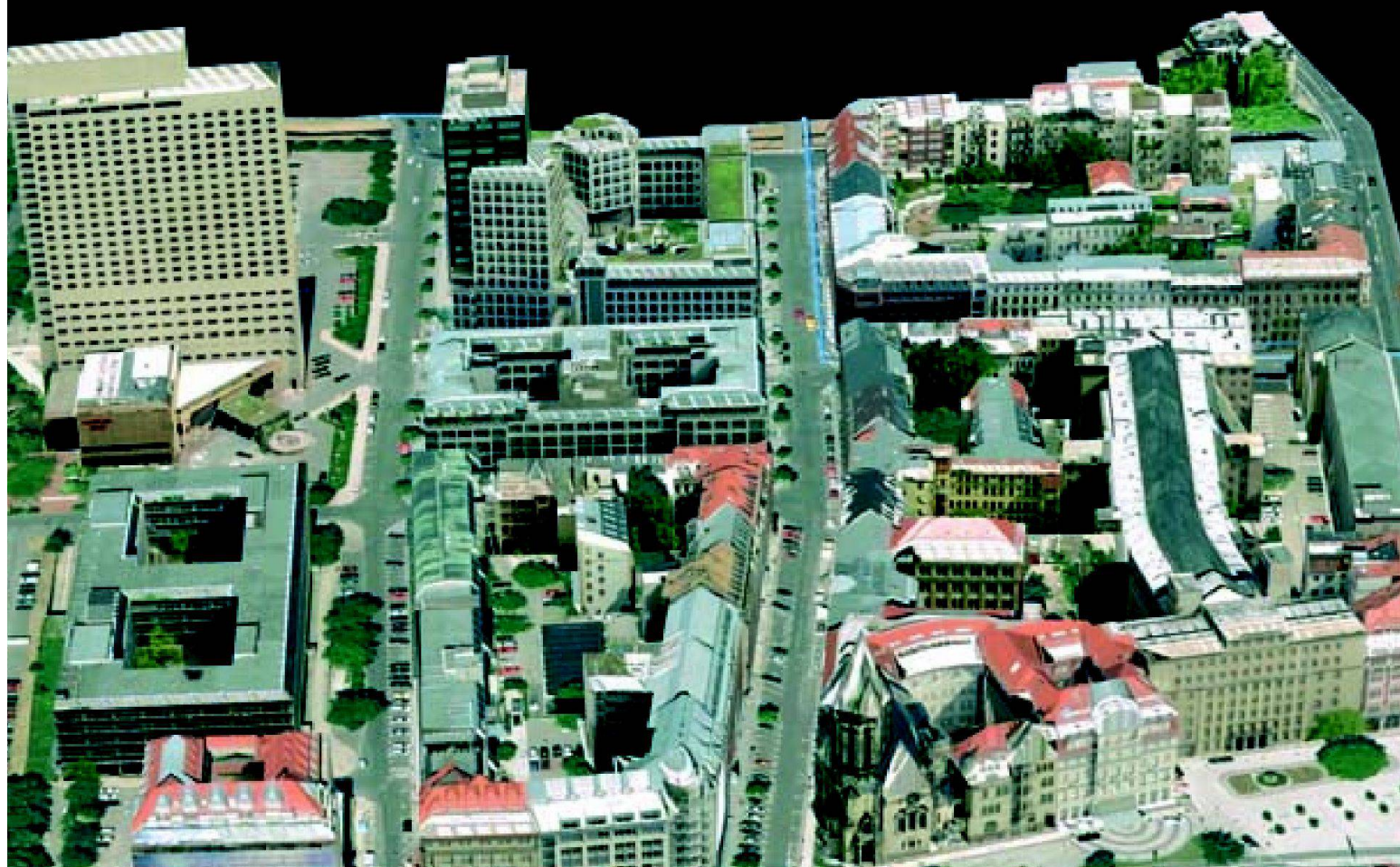
3D Stadtmodell entwickelt mit Autodesk® LandXplorer™.

EFFIZIENT PLANEN AUF BASIS AUSSAGEKRÄFTIGER DATEN UND MODELLE.