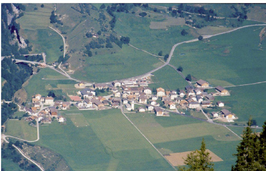
Abb. 6: Stallneubauten am Dorfrand in Donath, Kt. Graubünden.

Die gehäuft auftretenden Trockenperioden im ersten Jahrzehnt des 21. Jahrhunderts haben den Wunsch nach Bewässerungen wieder vermehrt aufgenommen lassen. Untersuchungen von Klimadaten lassen einen künftig grossen Bedarf an Zusatzbewässerungen zur Sicherung der Erträge vermuten.