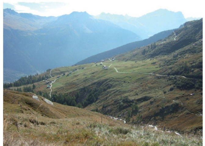
Abb. 2 und 3: Erschliessungen mit Betonspurstrassen am Schamser Berg, Kt. Graubünden.