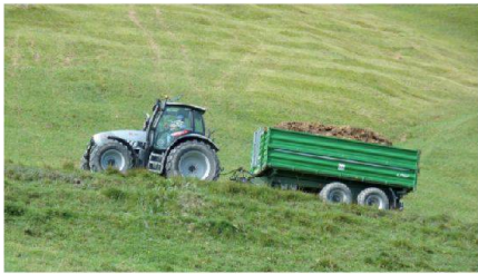
Abb. 7: Auch im Berggebiet haben grosse und schwere Maschinen Einzug gehalten.

der unsensiblen Behandlung des Kulturlandes bei Ortsplanungen, aber auch als Grundlage bei Gesamtmeliorationsprojekten, hat die suissemelio (Schweizerische Vereinigung für ländliche Entwicklung) angeregt, eine Wegleitung zur Landwirtschaftlichen Planung (LP) als Mittel der Wahrung der Interessen der Landwirtschaft auszuarbeiten. Die LP ist für die Beteiligten praxisnah, berührt sie direkt und kann damit zu realisierbaren Projekten führen. Die Wegleitung ist im Jahr 2009 veröffentlicht worden und bereits verschiedentlich in Anwendung.