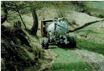
Abb. 4: Nicht zeitgemässe und gefährliche Erschliessungsanlage.

als vermessungstechnische Herausforderung zur Ermittlung der landwirtschaftlichen Nutzflächen und Entrichtung von Flächenbeiträgen an die Bewirtschafter zu einer Erleichterung bei der Erhebung des Grundeigentums bei.