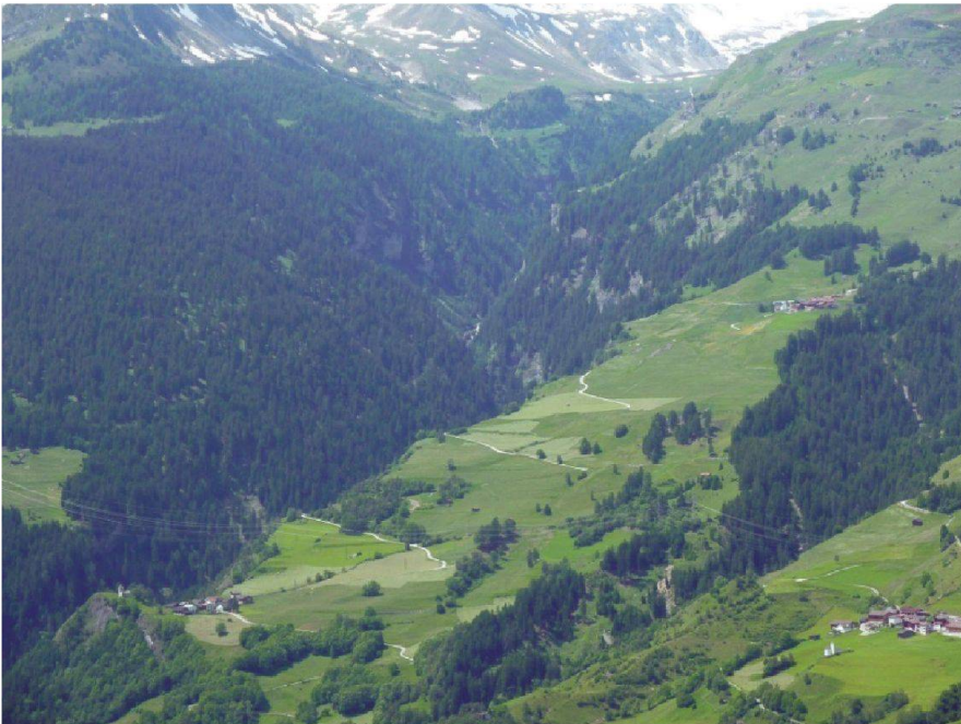
Abb. 1: Bewirtschaftung der Neuzuteilung am Schamser Berg, Kt. Graubünden.

Bau von Verbindungsstrassen in landwirtschaftlich geprägte Gebiete und für die Meliorationstätigkeit – nebst der Kredite aus der ordentlichen Rechnung – anfielen.