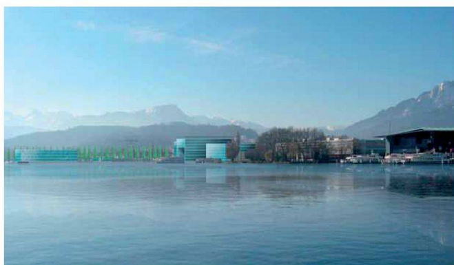
Abb. 1: Vision Tourismusstadt (aus: Die Stadt Luzern im Jahr 2022 – Perspektiven der Stadtentwicklung, Luzern 2007).

Das Leitbild für die Entwicklung von LuzernSüd vom September 2010 stellt eine