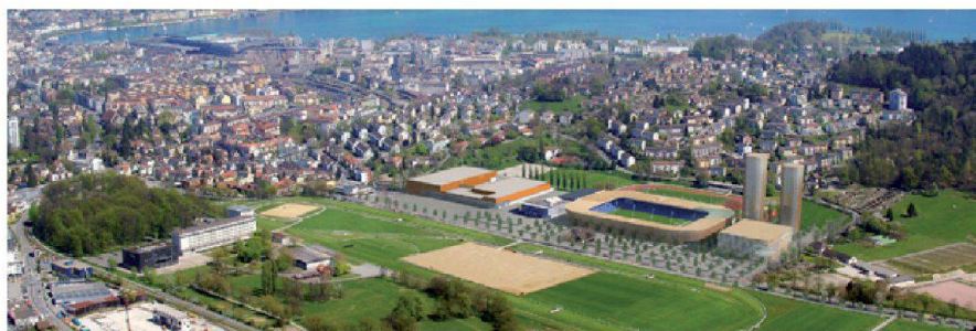
Abb. 4: Allmend Luzern mit neuem Stadion, zwei Wohnhochhäusern, Sportgebäude und Messehallen.

Wichtigster Teil des Mandats ist es, als Koordinator und treibende Kraft der Entwicklung von LuzernSüd Projekte voranzutreiben. Konkret bedeutet das, Eigentümer, Unternehmen und Investoren zusammenzubringen und für mögliche Vorhaben zu begeistern. Das bedingt auch den Einbezug der bereits ansässigen Bevölkerung, um eine Identität für die sich rasch verändernden Quartiere zu schaffen. Dazu dient beispielsweise der VBL-Bus mit dem LuzernSüd-Logo, der seit diesem Sommer in der Region verkehrt. Über