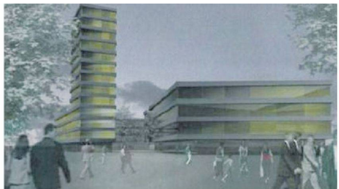
Abb. 6: Studie Mattenhof Kriens (Visualisierung: Scheitlin Syfrig).