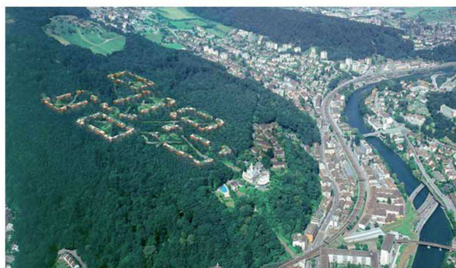
Abb. 2: Vision Waldstadt (aus: Die Stadt Luzern im Jahr 2022 – Perspektiven der Stadtentwicklung, Luzern 2007).