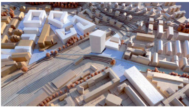
Abb. 5: Planungsgebiet Steghof Luzern.