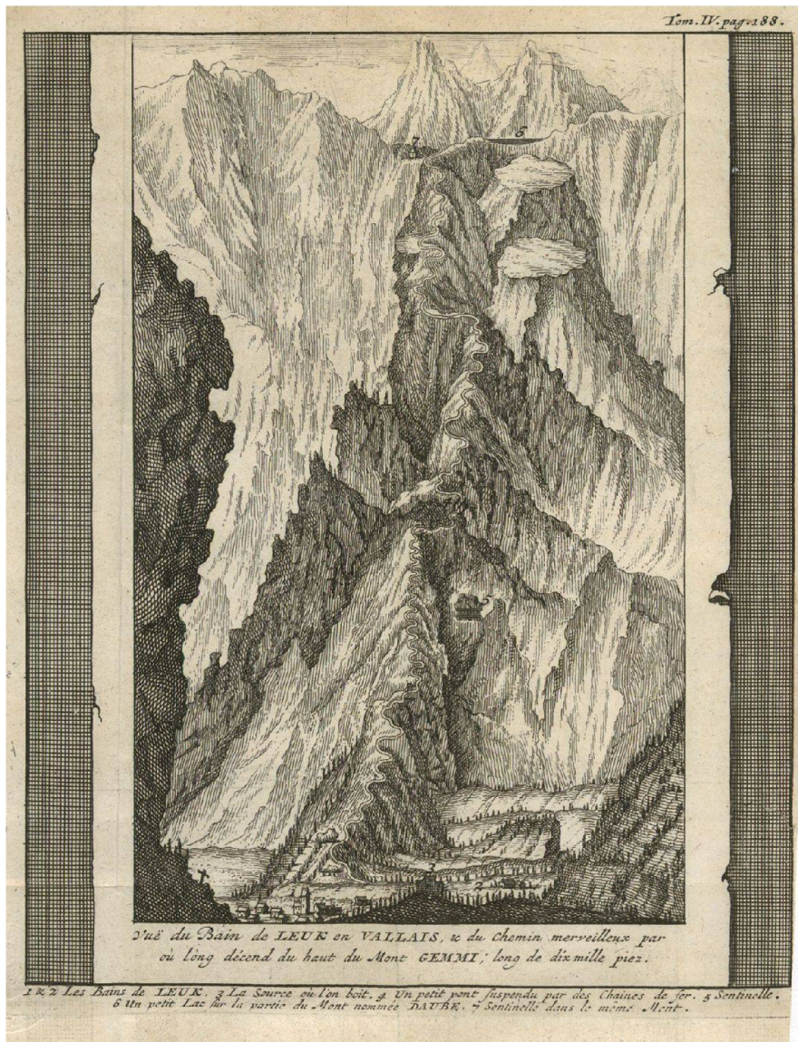
Fig. 1: «Vuë du Bain de Leuk en Vallais, & du Chemin merveilleux par où l'ong descend du haut du Mont Gemmi; long de dix mille piez». Ouvrage source: Altmann, Johann Georg, Ruchat, Abraham. L'état et les délices de la Suisse, 1730 (Bibliothèque cantonale et universitaire de Lausanne).

vantes, souvent accompagnées par des illustrations. Connues de manière dispersée et lacunaire, les illustrations des voyages sont aujourd'hui peu exploitées; elles ne sont jamais évaluées dans leur ensemble, ni globalement ni régionalement. Or elles constituent un important réservoir de sources historiques et géographiques, ainsi que de découvertes esthétiques, en même temps qu'un trésor patrimonial. Pour la Suisse et son image, globalement et régionalement, à l'intérieur comme vers l'extérieur, ces ouvrages