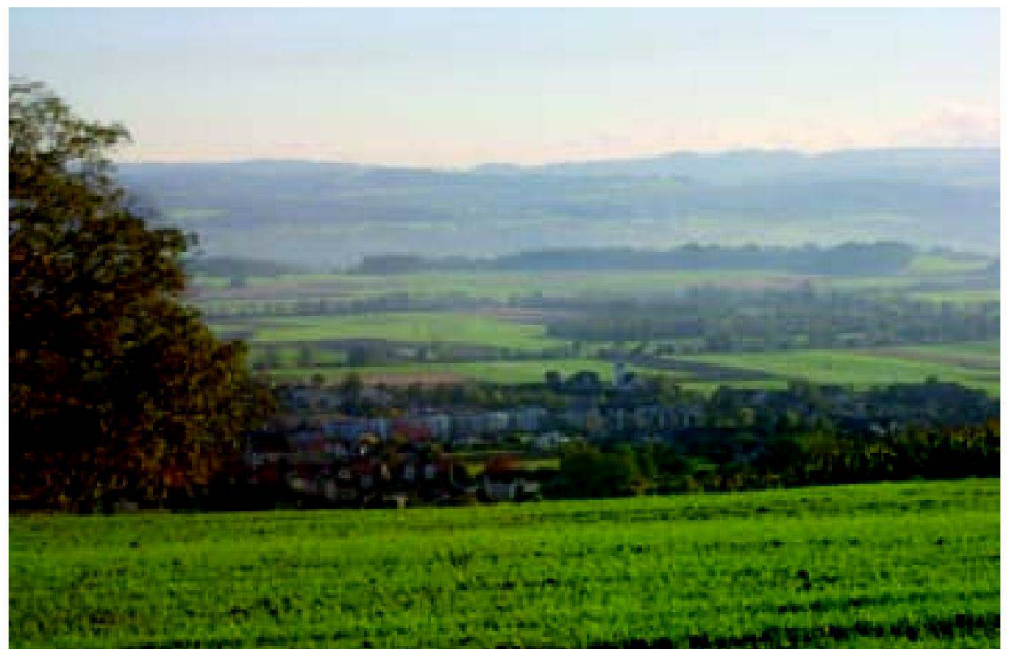
Abb. 1: Hecken und Obstgärten prägen das Landschaftsbild von Boswil (AG).

Nicht nur die Bodennutzung wurde untersucht, sondern auch die einzelnen