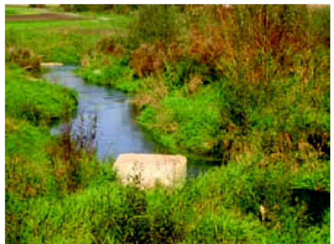
Abb. 2 und 3: Die Bünz vor der Gesamtmelioration: kanalisiert (links) und nachher: renaturiert (Fotos: Karin Bovigny-Ackermann, BLW).