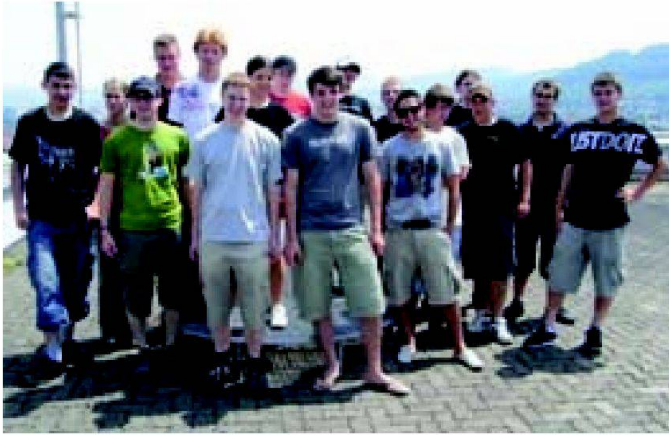
Teilnehmende der Geomatik-Summer-School 2010.