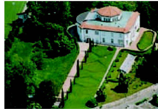
Museo Vincenzo Vela.

Der Park der Breggia-Schluchten zieht sich auf einer Strecke von etwa 1,5 km dem gleichnamigen Fluss entlang und deckt eine Gesamtfläche von 1,5 km 2 in den Gemeinden Baler-