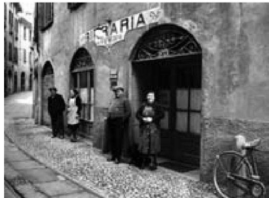
Nucleo storico di Mendrisio.