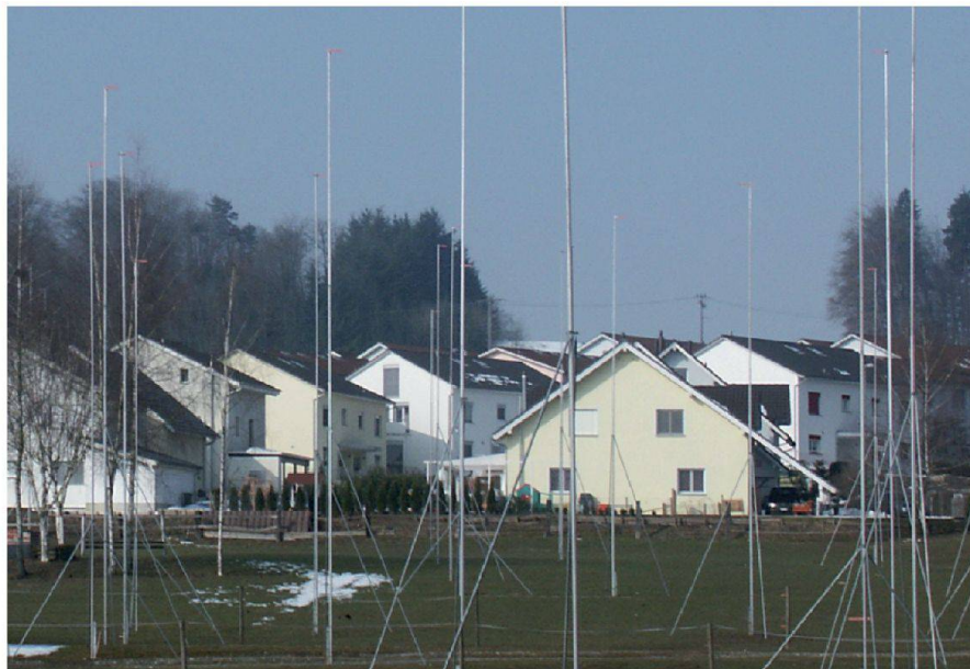
Abb. 1: Symbolbild für den Verlust der landwirtschaftlichen Produktionsflächen (Bild: www.baublatt.ch ).

Als Konsequenz wird eine Ingenieurgemeinschaft oder ein Generalunternehmen mit der technischen Leitung für das gesamte Werk mit sämtlichen planerischen Arbeiten beauftragt. Die eingesetzten Fachleute können so die unterschiedlichen Interessen optimal aufeinander abstimmen und koordiniert bearbeiten. Dadurch findet eine erste Synthese der Projekthalte statt, bevor die auf-