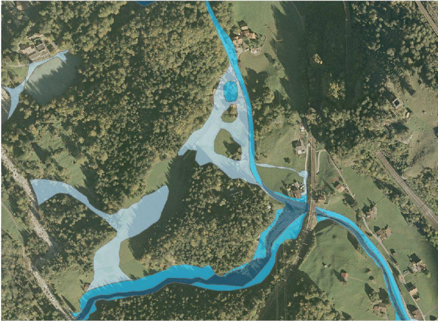
Abb. 2: Ausschnitt der kartierten Überflutungsflächen im Bereich Blausee, Gemeinde Kandergrund (Flotron AG / Emch+Berger AG).