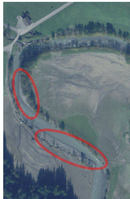
Abb. 4: Links: 13.10.2011, die Kander oberhalb Kandersteg führt drei Tage nach dem Ereignis immer noch viel Wasser. Rechts: 17.10.2011, Auflandungen im Gerinne sind erst auf den Aufnahmen zu erkennen, welche sieben Tage nach dem Ereignis aufgenommen wurden.