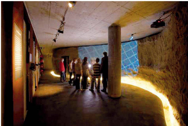
Abb. 2: Die Ausstellung vermittelt einen Einblick in verschiedene Aspekte dieses frühindustriellen Baudenkmals, in die Technik, in die Geologie, wie auch in die Ideen und Biografien ihrer Erbauer.

Stadtmuseum Aarau Schlossplatz 23 CH-5000 Aarau museum@aarau.ch www.museumaarau.ch