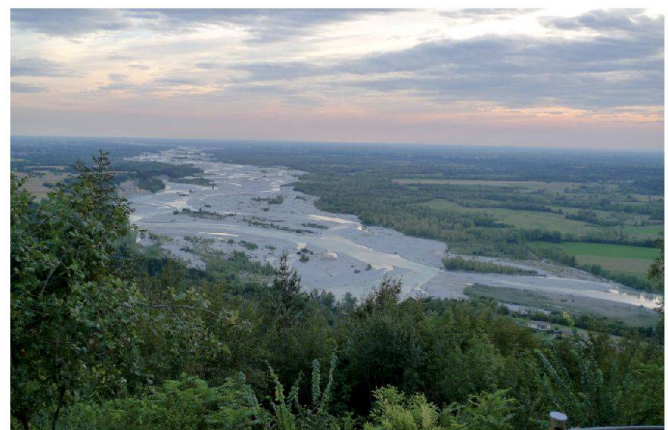
Abb. 1 und 2: Tagliamento Oberlauf mit Blick auf Amaro in der Bildmitte. Links von Amaro verdeckt der Doppelhügel Mt S. Simeone (Epizentrum des Erdbebens 1976); Tagliamento Unterlauf mit Sicht Richtung Adria (Fotos: Maria Küntzel und Ruedi Werder).