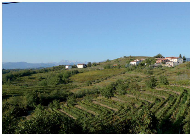
Abb. 8: Die Weinberge in den Colli Orientali del Friuli gehen flussend nach Slowenien weiter. Im Hintergrund die Julischen Alpen (Mt Canin).