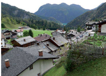
Abb. 5: Fraktion Sauris sotto mit Blick vom Kirchhügel gegen Osten und auf den Stausee.

See, um die Lagune zu «erfahren». In Porto Buso machte uns Prof. Claudio Marchesini mit einigen Vermessungsproblemen vertraut, die sich aus dem niedrigen Wasserstand, der ungleichmässigen Tiden und der Hebung des Wasserspiegels oder der Absenkung des Küstenbereichs ergeben. Trotz vieler und genauer Messungen lassen sich einige Phänomene nur schwer erklären.