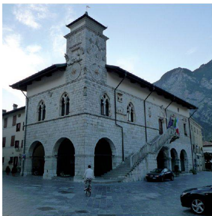
Abb. 6: Rathaus von Venzano, das komplett durch das Erdbeben von 1976 zerstört und anschliessend rekonstruiert wurde.

werden. An den Helikoptern können zudem Magnetometer und Gamma-Strahlen-Messgeräte angebracht werden.