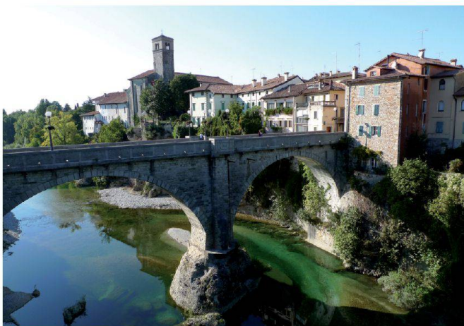
Abb. 7: Die Teufelsbrücke in Cividale über den Natisone, im 1. Weltkrieg zerstört und wieder aufgebaut.

Der Nachmittag war der Stadt Cividale, rund 20 km östlich von Udine, gewidmet. Cividale spielte über Jahrhunderte eine wichtige Rolle. Schon 50 v. Chr. gründe-