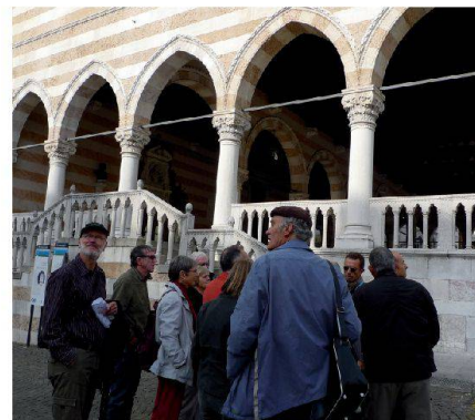
Abb. 4: Udine, eine sehenswerte Stadt: historisches Rathaus und offene Halle (Loggia).

Der Besuch auf dem Bauernhof Chinotto zeigte die Problematik der Salzwasserinfiltration in der Uferzone, obwohl in den Dämmen 12 m tiefe Spundwände abgetäuft wurden. Das Salzwasser vermindert die Produktivität der an sich guten Böden sehr stark. Da etwa zwei Drittel seiner 18 ha versalzt sind, führt dies zu einer Gefährdung der Existenz des betroffenen Be-