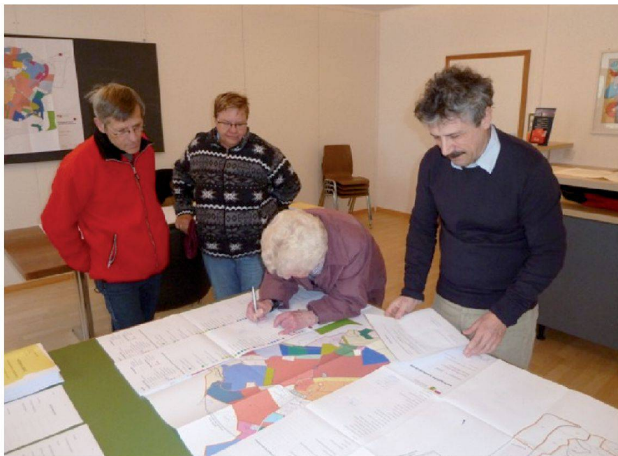
Abb. 4: Unterzeichnung der definitiven Neuzuteilung.

Parzellen und 28 Grundeigentümern. Nicht einbezogen wurden das Baugebiet und bereits früher im bernischen Verfahren meliorierte Flächen.