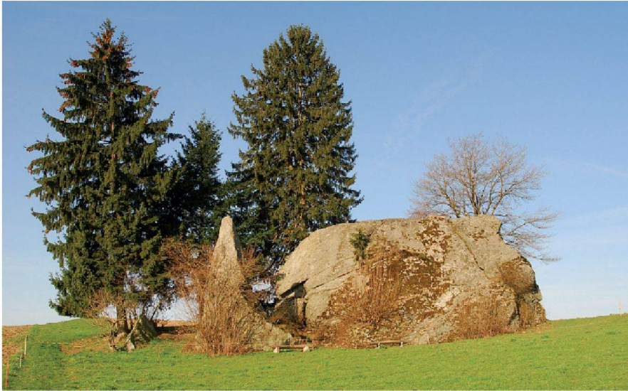
Abb. 2: «Grosse Fluh», erratischer Block des eiszeitlichen Rhonegletschers.

Für die Umsetzung wurde das Verfahren der Vertraglichen Landumlegung nach dem Bundesgesetz über die Landwirtschaft (LwG) gewählt. Das Solothurnische Bauernsekretariat hat das Projekt fachlich und agronomisch begleitet. Das Verfahren wurde von der Abteilung Strukturverbesserungen des kantonalen Amtes für Landwirtschaft koordiniert und unterstützt.