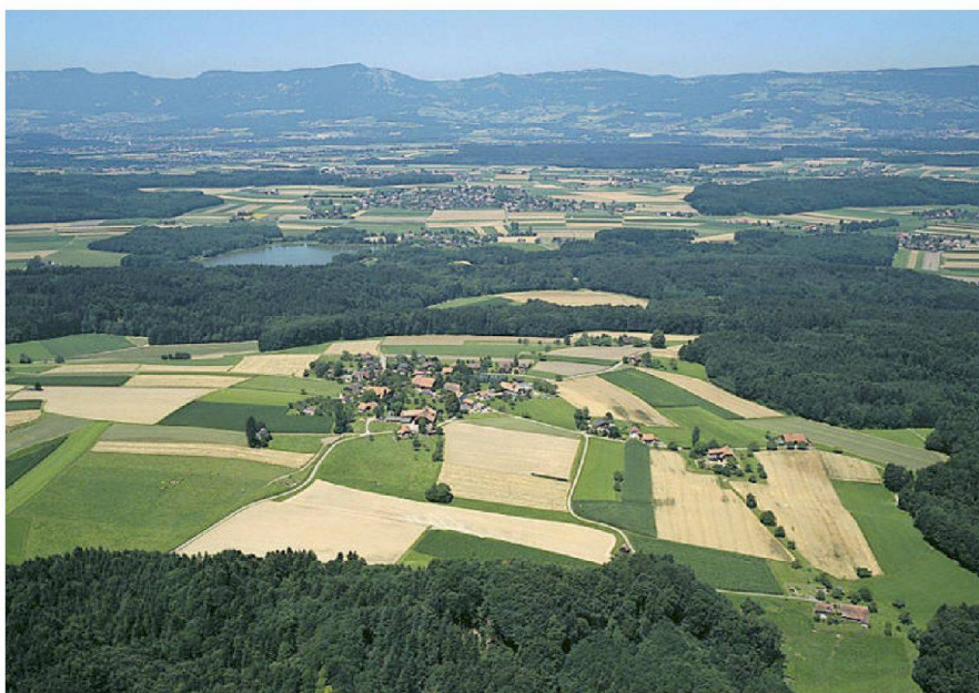
Abb. 1: Steinhof, Ortsteil der Gemeinde Aeschi (SO).

Die Solothurner Gemeinde Steinhof im Bezirk Wasseramt ist vollständig vom Kanton Bern umschlossen. Sie umfasst 163 ha; davon 48 ha Wald. In Steinhof wohnen 150 Personen. Drei Familienbetriebe bewirtschaften 77 ha landwirtschaftliche Nutzfläche und halten 115 Grossvieheinheiten. Nebst Ackerbau und Rindviehmast werden jährlich 400 000 kg Milch produziert. Am 1. Januar 2012 hat die Gemeinde Steinhof mit der nächstgelegenen Solothurner Gemeinde Aeschi fusioniert. Fast alle Wasserämter-Gemeinden haben mit Güterregulierungen (Meliorationen) umfangreiche Entwässerungsanlagen gebaut. Einige haben mit der «Bahn 2000»