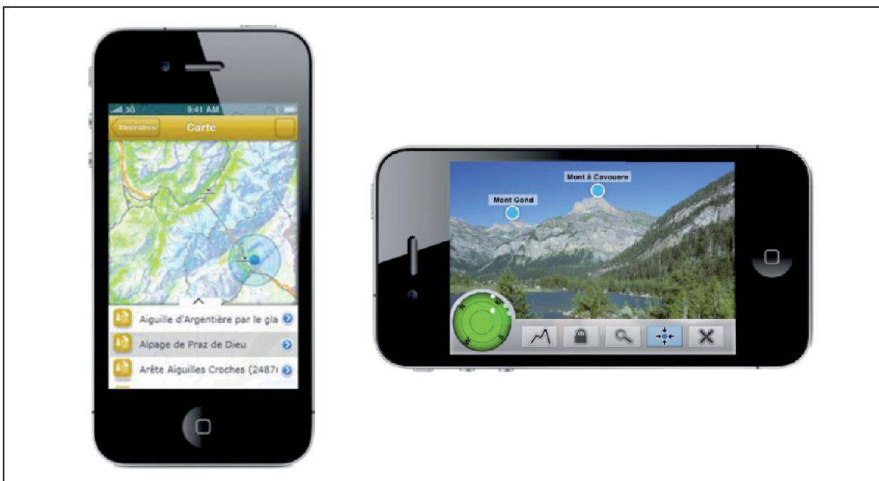
Fig. 2: Application iPhone.