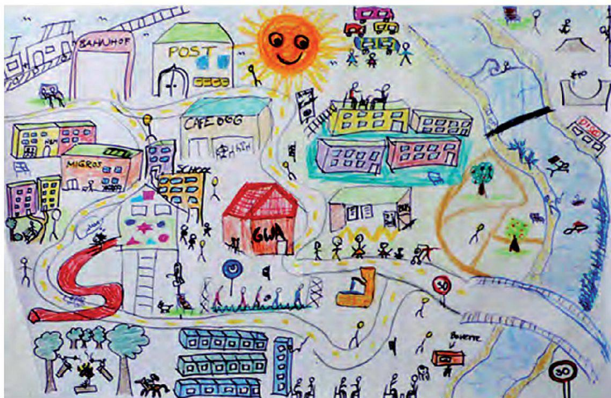
Abb. 2: Kognitive Karte eines Quartiers nach sozialen Kriterien und Vorstellungen von Studierenden der Sozialen Arbeit.

pe wichtige Planungsvorhaben bereits vor der Realisierung und angereichert durch Stadtteilbegehungen, Mental Maps/kognitive Karten (s. Abb. 2 und 3) und anderen sozialräumlichen Methoden zu weiteren, primär nicht ersichtlichen, aber planungsrelevanten Informationen führen können. Die forschungsleitenden und sich methodisch an Sozialwissenschaft und Geomatik gerichteten Fragen lauten hierbei: Wie lassen sich Raumvorstellungen und Entwicklungsszenarien unter räumlichen und sozialen Kriterien methodologisch erfassen? Wie lassen sich Bilder der Zukunft darstellen? Welche partizipativen Eigenschaften in der Kombination aus sozialer Bedeutung und technischer Umsetzung müssen Instrumente besitzen, um in einem Planungsprozess zur Anwendung zu kommen? Wie kann ein transdisziplinärer und multiperspektivischer Dialog unterstützt werden?