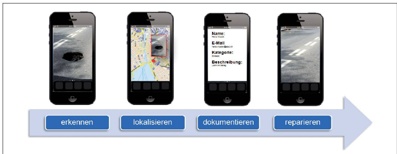
Abb. 1: Grundidee von «Züri wie neu».