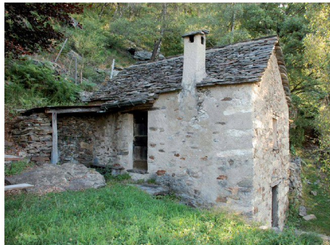
Fig. 3 e 4: Esempi di edifici meritevoli di conservazione (rustici).

L'approvazione quasi all'unanimità del PUC-PEIP ( www.ti.ch/puc-peip ) da parte del Gran Consiglio, avvenuta l'11 maggio 2010, avrebbe dovuto costituire per così dire l'atto risolutivo della complessa questione legata alla gestione dei rustici, ma purtroppo non è stato il caso. Il ricorso presentato dall'Ufficio federale dello sviluppo territoriale (ARE) ha infatti imposto un'ulteriore negoziazione. Il ricorso concerne in particolare due aspetti: