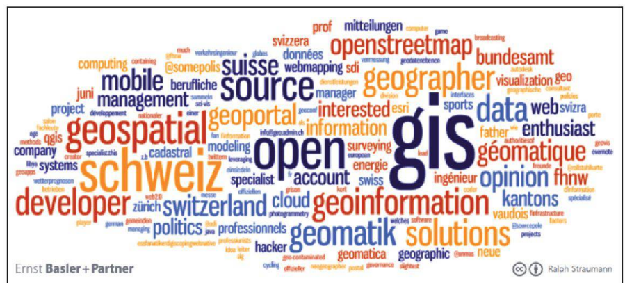
Abb. 1: Wordcloud aus den Twitter-Biographien der gefundenen Nutzerinnen und Nutzer.

Abbildung 1 zeigt eine so genannte Wordcloud der Begriffe aus den «Twitter-