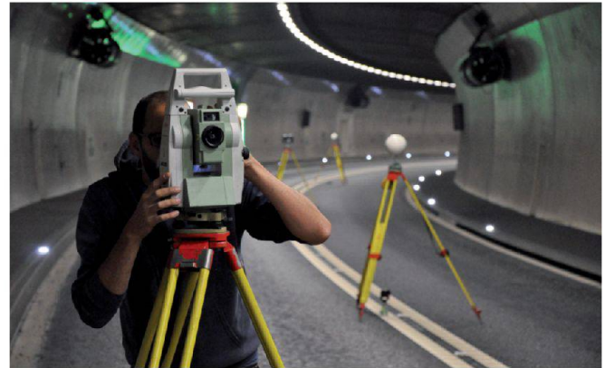
Netzausgleichung in der Tunnelvermessung, hier Gotschnatunnel © J. Engewald, Lutz Schmid Ingenieure AG.

Geodätische Grundlagennetze stellen eine wichtige Basis bei Bauprojekten dar. An die verwendete Ausgleichungssoftware werden dabei unterschiedlichste Anforderungen gestellt: Sie muss verschiedenste Messdaten aus Tachymetrie, GPS und Nivellement kombinieren können und diverse Varianten der Netzausgleichung (1D, 2D, 3D, weiche Lagerung, freier, gezwängter oder korrelierter Ausgleich) sowie Werkzeuge zur Netzanalyse bieten. Übersichtliche Protokollierung und grafische Darstellung des berechneten Netzes sorgen für einen raschen Überblick. All das bietet rmNETZ, die geodätische Ausgleichungssoftware von rmDATA. Mit ihr wurden bereits tausende Grundlagennetze für Baustellen weltweit bestimmt. Ausserdem findet das Programm im Kataster, in der Industrievermessung und diversen weiteren ingenieurgeodätischen Anwendungen seinen erfolgreichen Einsatz. Denn gerade die einfache Bedienung von rmNETZ überzeugt die vielen Anwender.