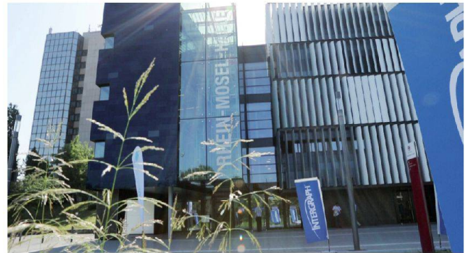
Eingang zur Rhein-Mosel-Halle, Koblenz.