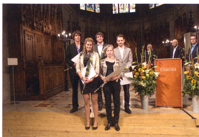
Frischgebackene Master of Science in Engineering der HABG.