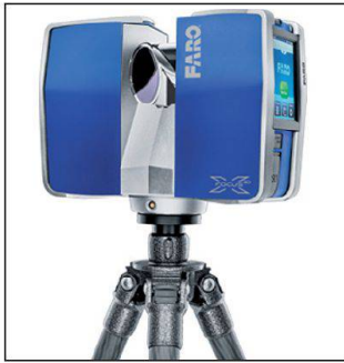
FARO Focus3D X 330 Laser Scanner.

Der neue Focus3D X 330 besticht durch Funktionalität und Leistung. Mit einer fast dreimal so grossen Reichweite wie sein Vorgänger kann der Focus3D X 330 nun Objekte bei vollem Sonnenlicht scannen, die bis zu 330 m weit entfernt sind. Dank seines integrierten GPS-Empfängers kann der Laserscanner in der Nachbearbeitung die Einzelscans noch schneller registrieren und zu einer hochgenauen Punktwolke zusammenführen. Dies macht den Focus3D X 330 zum idealen Instrument für Vermessungsanwendungen.