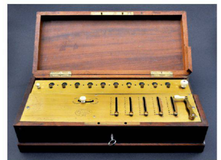
Abb. 1: Thomas-Arithmometer aus Paris. Ein Meilenstein in der Geschichte der Rechentechnik: Das am 28. Januar 2014 in der Kulturgütersammlung der ETH Zürich (wieder) gefundene 150-jährige Thomas-Arithmometer, eine Vierspezies-Staffelwalzenmaschine aus Messing und Holz.

Das Thomas-Arithmometer beherrscht alle vier Grundrechenarten Addition, Subtraktion, Multiplikation und Division (Vierspeziesmaschine). Es handelt sich dabei um eine Staffelwalzenmaschine (im Un-